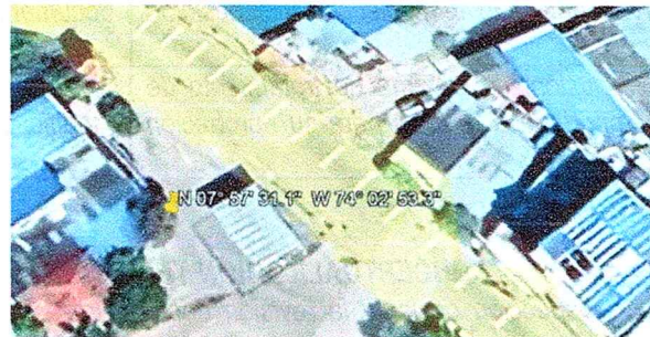
Figura N°1 Google Earth